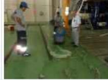
Samulaş'ta Endüstriyel Temizlik Ve Hijyen Eğitimi