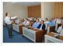
Canik'te Organ Bağışi Semineri