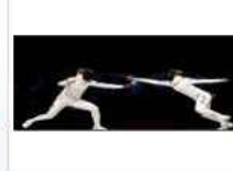
Büyükler Kılıç Türkiye Şampiyonası Başlıyor