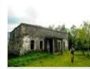
200 Yıllık Tarihi Kilise Restore