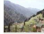
Ayder Yaylası turistlerin gözde