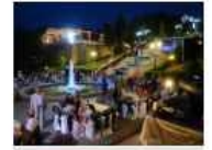
Karadeniz'in en büyük sosyal tesisi