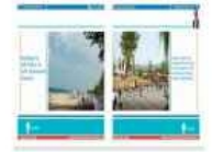
Büyükşehir Belediyesi Proje