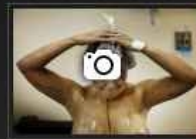
Estetik Öyle Kolay Olmuyor