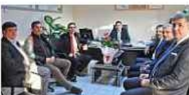
İtso Yönetiminden Uedaş'ın Yeni Müdürüne...