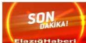
Borsa İlk Seansı 82 Binin Altında Tamamladı