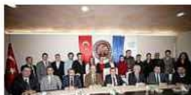
Trabzonlu Firmalar Dışa Açılıyor