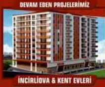
İNCİRLİOVA 6 KENT EVLERİ