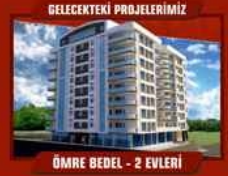
ÖMRE BEDEL - 2 EVLERİ