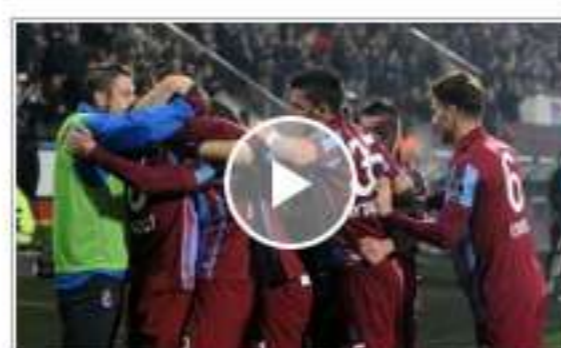
Trabzonspor, Başakşehir'i 3-2 mağlup etti