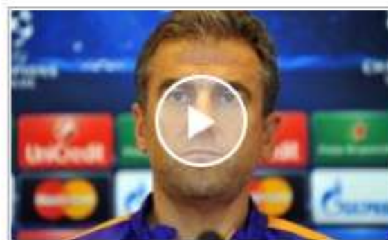
'Bencilliğe başlarsak faturasını ağır...