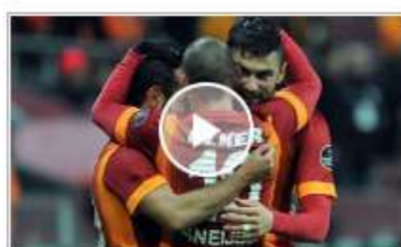
Galatasaray, Balıkesirspor'u 3-1 mağlup etti