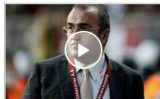
Albayrak'tan Özgecan açıklaması