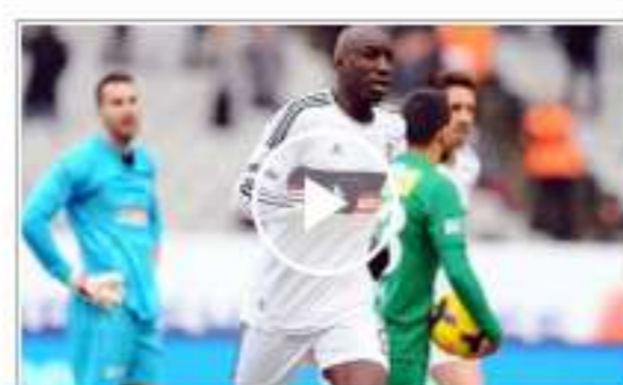
Beşiktaş, Bursaspor'u 3-2 mağlup etti