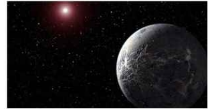
Dünyaya benzeyen dünyadan sinyal geldi!