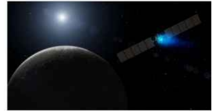
Nihayet cüce gezegen Ceres'e ulaşıldı