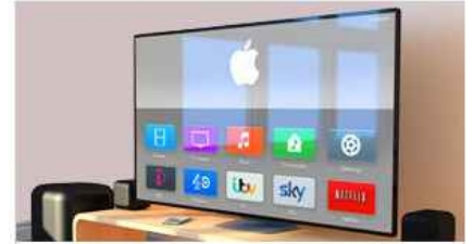
Apple Tv fiyatları dibe vurdu