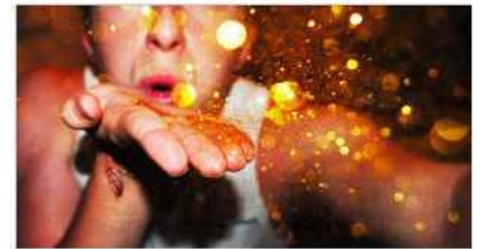
İntikamınızı sim paketiyle alın!