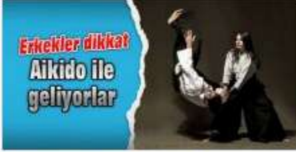
Erkekler dikkat: Aikido ile geliyorlar