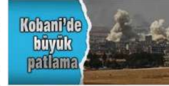
Kobani'de büyük patlama