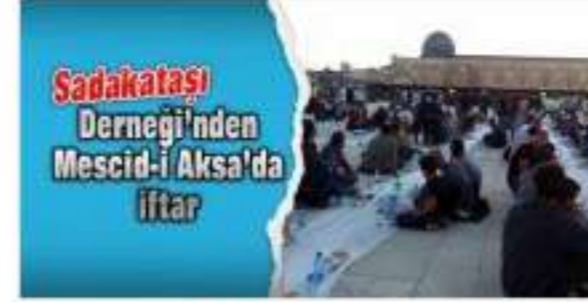
Sadakataşı Derneği'nden Mescid-i Aksa'da iftar