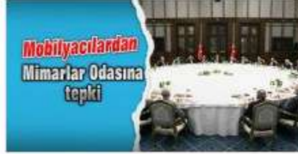
Mobilyacılarından Mimarlar Odasına tepki