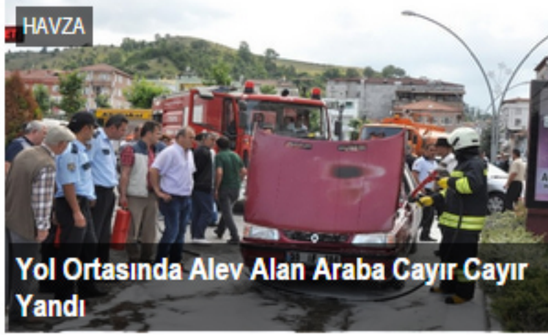
Yol Ortasında Alev Alan Araba Cayır Cayır Yandı