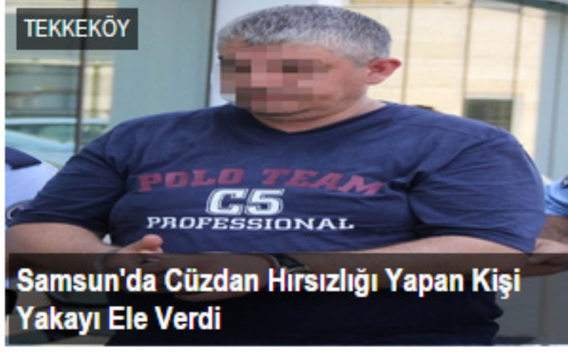
Samsun'da Cüzdan Hırsızlığı Yapan Kişi Yakayı Ele Verdi