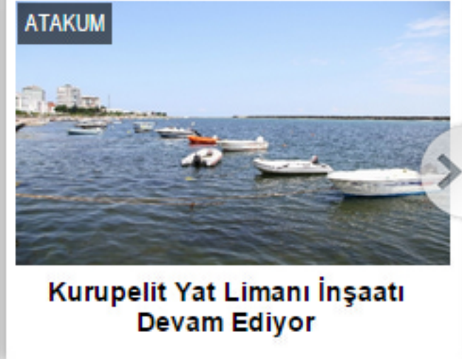
Kurupelit Yat Limanı İnşaatı Devam Ediyor