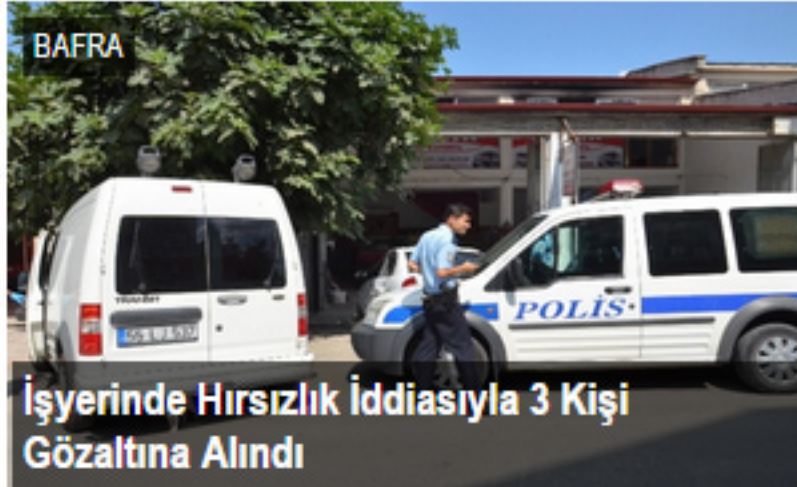
İşyerinde Hırsızlık İddiasıyla 3 Kişi Gözaltına Alındı