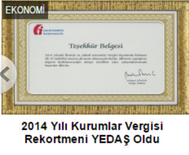
2014 Yılı Kurumlar Vergisi Rekortmeni YEDAŞ Oldu