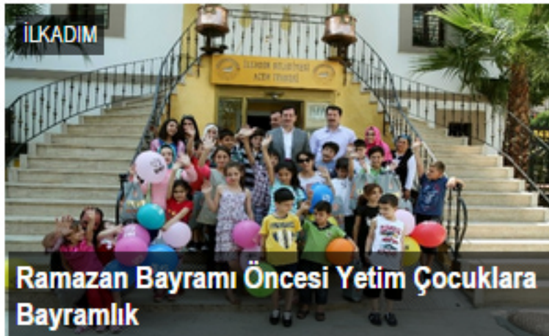
Ramazan Bayramı Öncesi Yetim Çocuklara Bayramlık