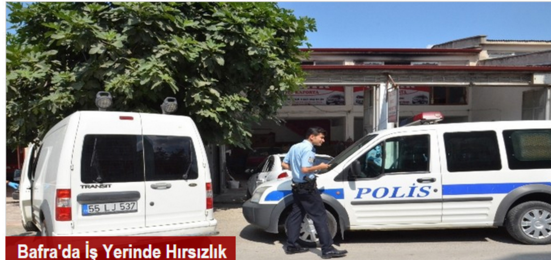
Bafra'da İş Yerinde Hırsızlık

Toplam 0 yorum. Tüm yorumları okumak için tıklayın.