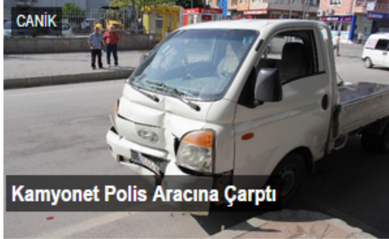
Kamyonet Polis Aracına Çarptı