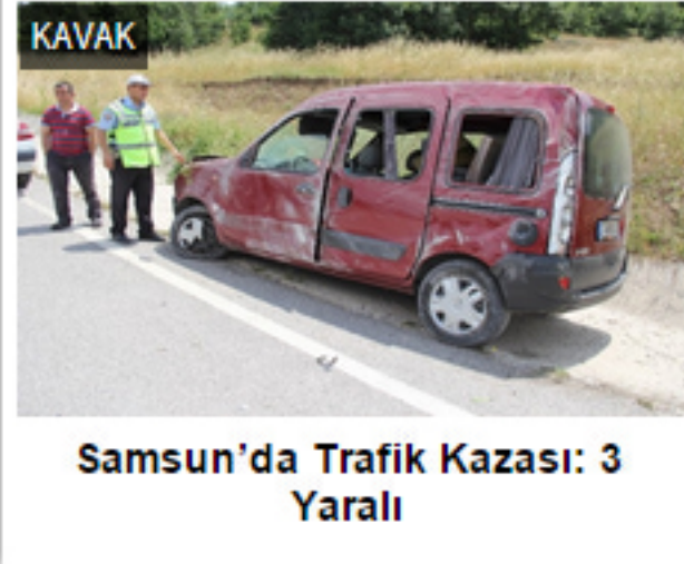
Samsun'da Trafik Kazası: 3 Yaralı