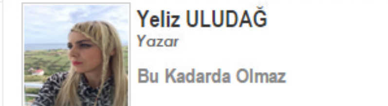
Yeliz ULUDAĞ Yazar