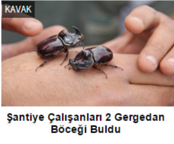
Şantiye Çalışanları 2 Gergedan Böceği Buldu