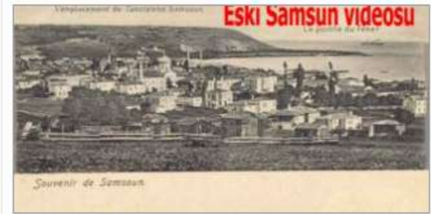
Türkülerle eski Samsun