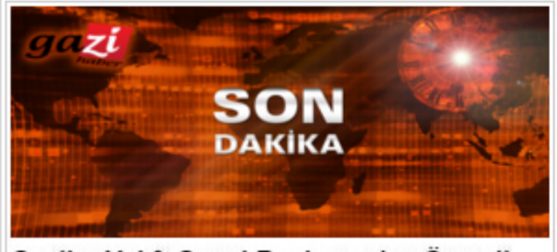
Gaziler Vakfı Genel Başkanından Önemli Açıklama!