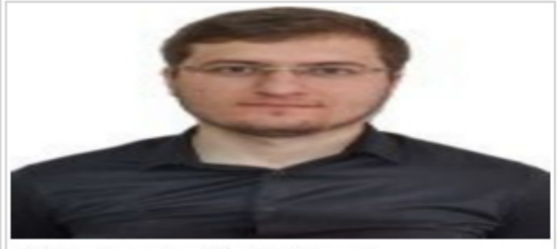
Dünya Hayatı Sizi Aldatmasın