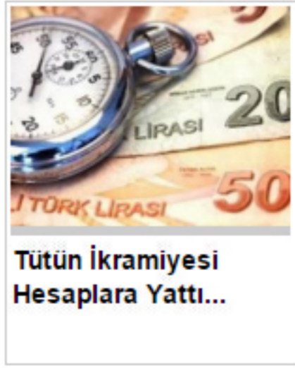
Tütün İkramesi Hesaplara Yattı...