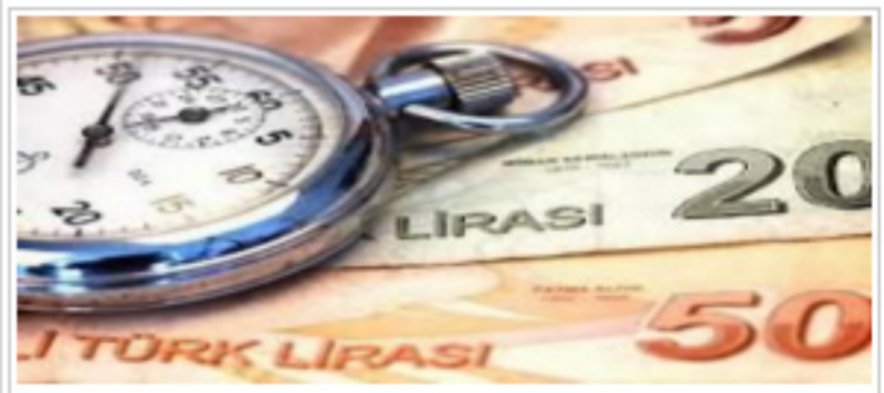
Tütün İkramesi Hesaplara Yattı