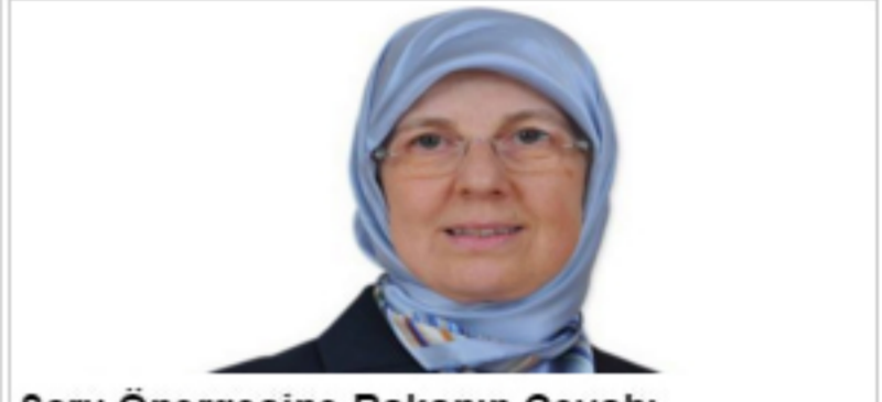
Soru Önergesine Bakanın Cevabı