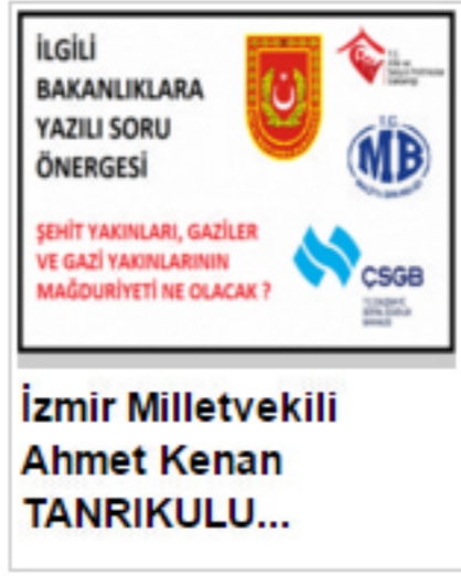
İzmir Milletvekili Ahmet Kenan TANRIKULU...