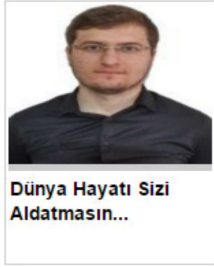
Dünya Hayatı Sizi Aldatmasın...