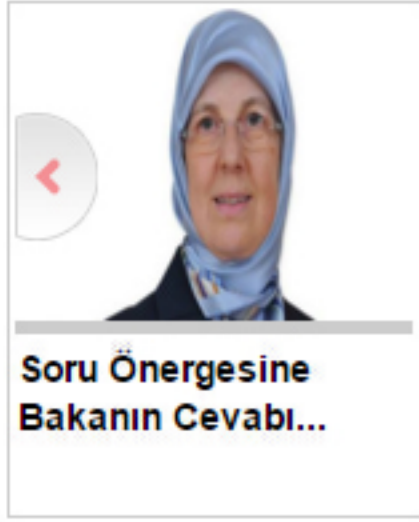
Soru Önergesine Bakanın Cevabı...