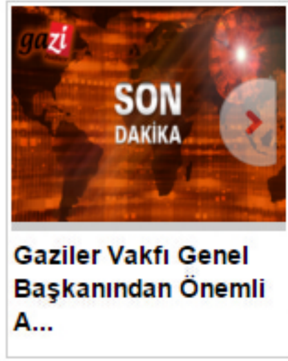
Gaziler Vakfı Genel Başkanından Önemli A...