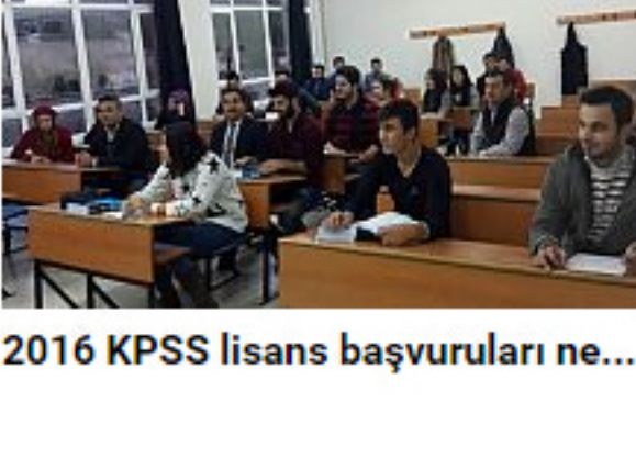
2016 KPSS lisans başvuruları ne...