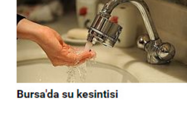
Bursa'da su kesintisi