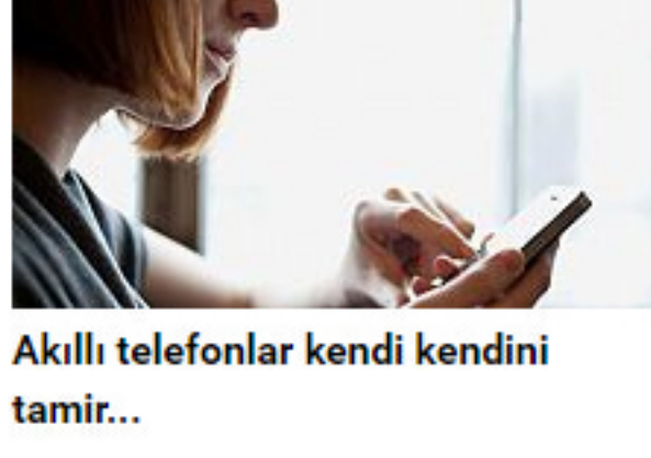
Akıllı telefonlar kendi kendini tamir...