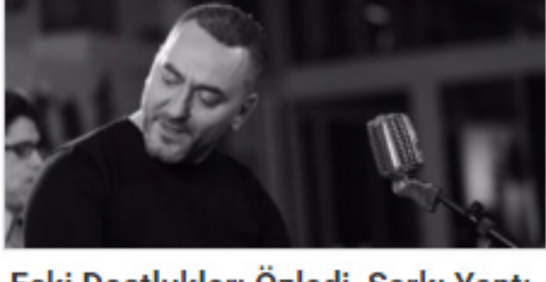
Eski Dostlukları Özledi, Şarkı Yaptı