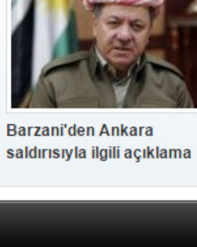
Barzani'den Ankara saldırısıyla ilgili açıklama