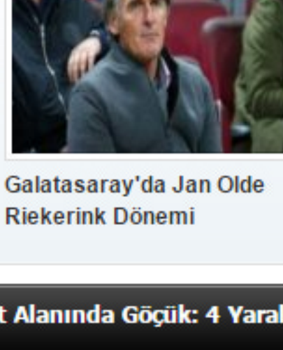
Galatasaray'da Jan Olde Riekerink Dönemi