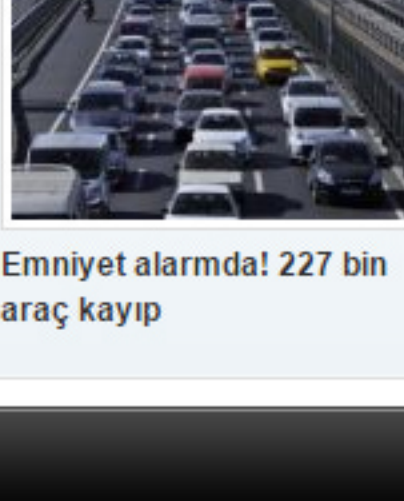
Emniyet alarmında: 227 bin araç kayıp