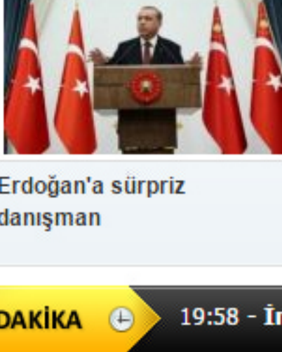
Erdoğan'a sürpriz danışman